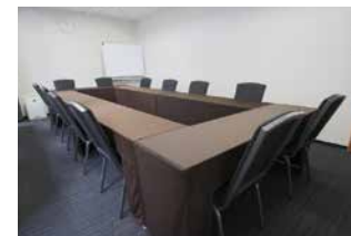
ミーティングルーム 11H (15)