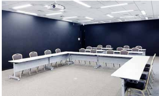
カンファレンスルーム B